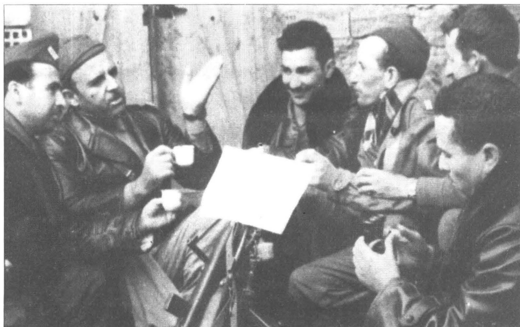
Quelque part en Kabylie : Krim Belkacem (à gauche) avec Mohammedi Saïd.