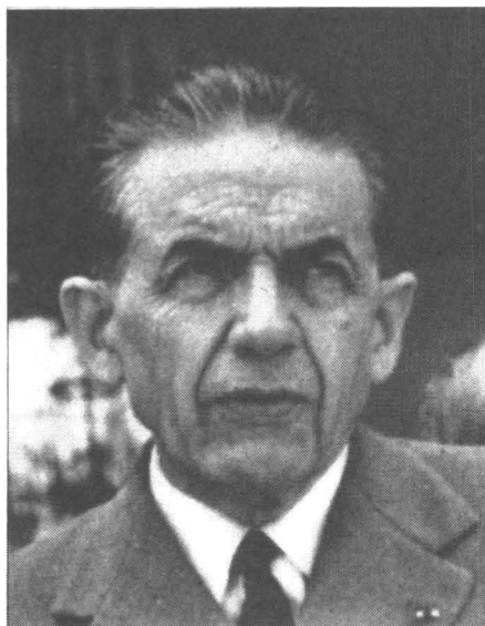
Saint Edmond Michelet : un curieux apôtre.

Dès les premiers échanges, les positions se révèlent inconciliables. Le FLN exige une négociation globale ; élément parmi d'autres, le cessez-le-feu s'intègre dans le lot des questions politiques que traiteront Ferhat Abbas et de Gaulle. Pour les Français, le cessez-le-feu constitue un préalable au démarrage du processus conduisant à l'autodétermination. « Une