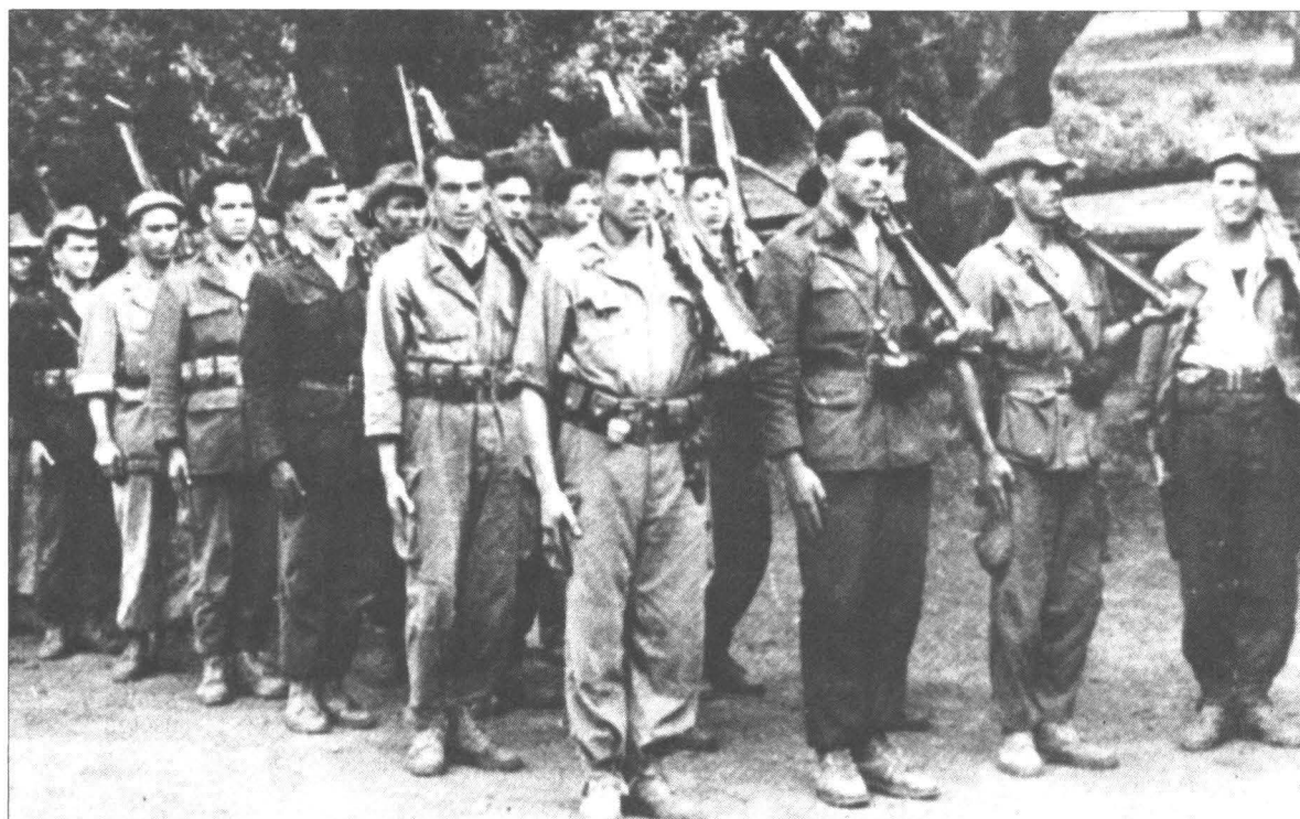
Des unités rebelles à rallier... si on l'avait vraiment voulu.