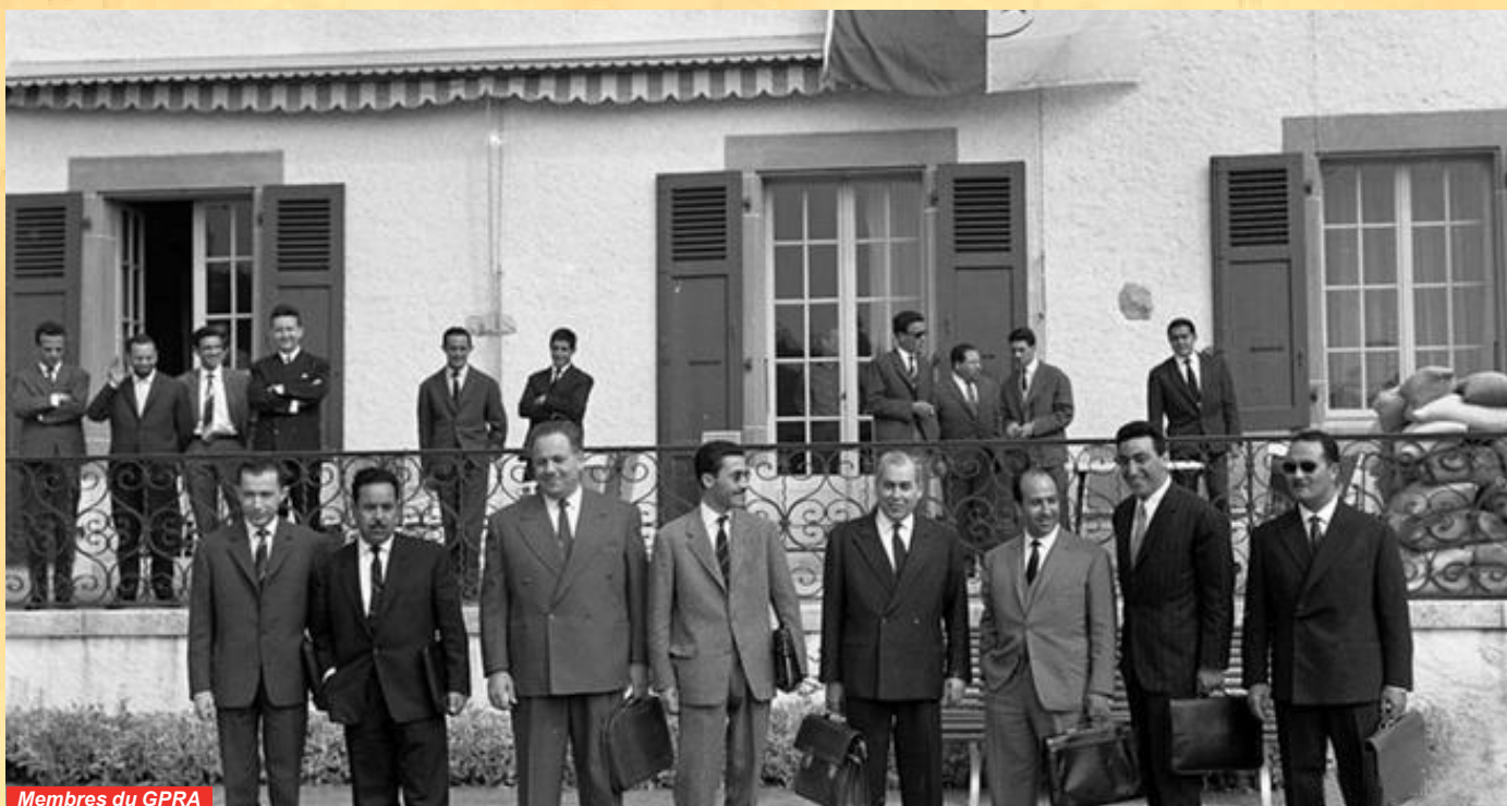
Membres du GPRA