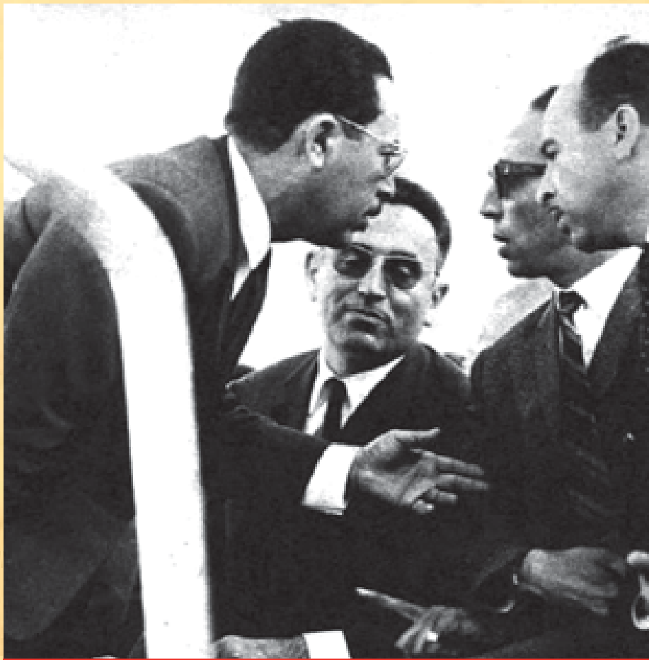
Saâd Dahleb, Benyoucef Benkhedda, Mohamed Boudiaf et Krim Belkacem

juin 1961 étaient morts en moins d'un mois. Au même moment, débutent les premiers pourparlers entre le gouvernement français et le GPRA qui vont se poursuivre jusqu'à la libération du pays, mais la méfiance envers les combattants la Wilaya IV laissera des séquelles profondes jusqu'après l'indépendance, avec notamment l'affrontement sanglant et «honteux» qui opposera les troupes de l'armée des frontières aux résistants de la Mitidja et de l'Ouarsenis. Tout ce qui a changé c'est que, pour une fois, la Wilaya IV – avec d'autres wilayas – était du côté du GPRA pour contester ce qu'ils qualifiaient de «coup de force» de l'état-major général de l'armée.