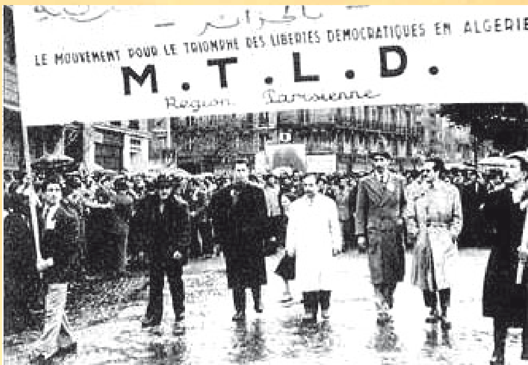
Manifestation des émigrés algériens à Paris en 1956

Si d'aucuns admettent aujourd'hui que le mouvement créé par Messali Hadj pour tenter de reprendre l'initiative après la saisissions du PPA/MTLD qui va accélérer le déclenchement de l'insurrection armée, le 1er novembre 1954, avait en quelque sorte une raison d'exister, tout le parcours de ses partisans regroupés dans les maquis du MNA est fait de trahisons et de complots contre la révolution. Ce qui, automatiquement, va pousser ce mouvement dans le giron de l'ennemi, soit en servant tacitement ses desseins, soit en s'alliant directement avec l'armée française contre les combattants de l'ALN, comme l'illustrent tant de batailles mémorables.