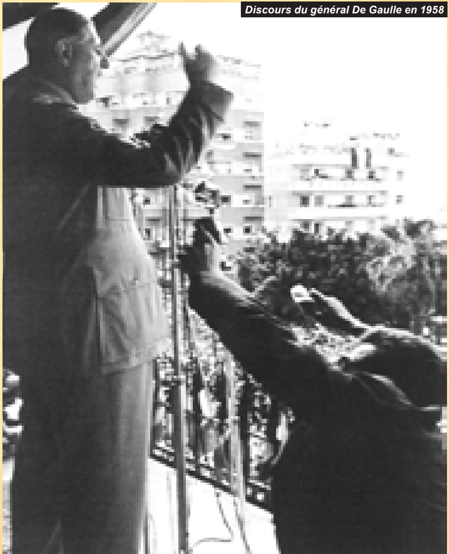
Discours du général De Gaulle en 1958

Alliant désinformation et intoxication, cette presse à la solde du colonialisme, a rendu compte de cet événement avec faste, tout en essayant de pervertir les faits pour les besoins de la cause. C'est le cas, par exemple, de Feuille d'avis de Neuchâtel, quotidien francophone paraissant en Suisse, qui, dans son édition du 24 mars 1959, commente la nouvelle en titrant en une : «La reddition du bataillon rebelle pourrait accélérer les ralliements en Algérie ». Dans son compte-rendu bien inspiré et illustratif de cette presse vouée à la propagande, le correspondant du journal à Paris évoque