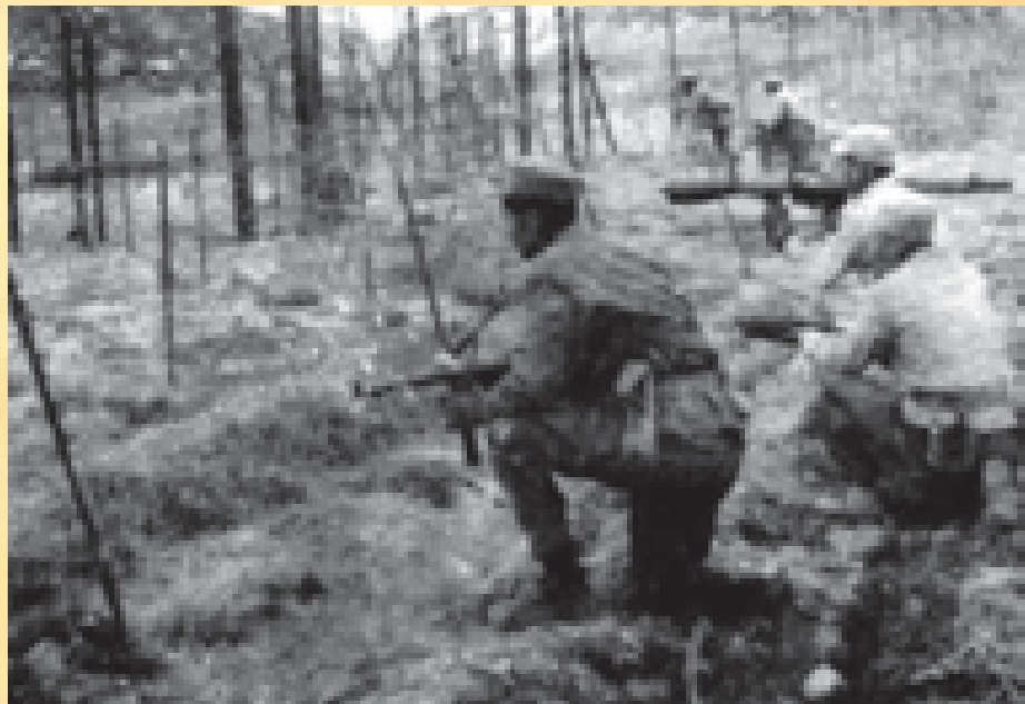
Moudjahidine de l'ALN attaquant la ligne Morice pour acheminer des armes

C'est en tout cas ce que pensent plusieurs anciens combat-