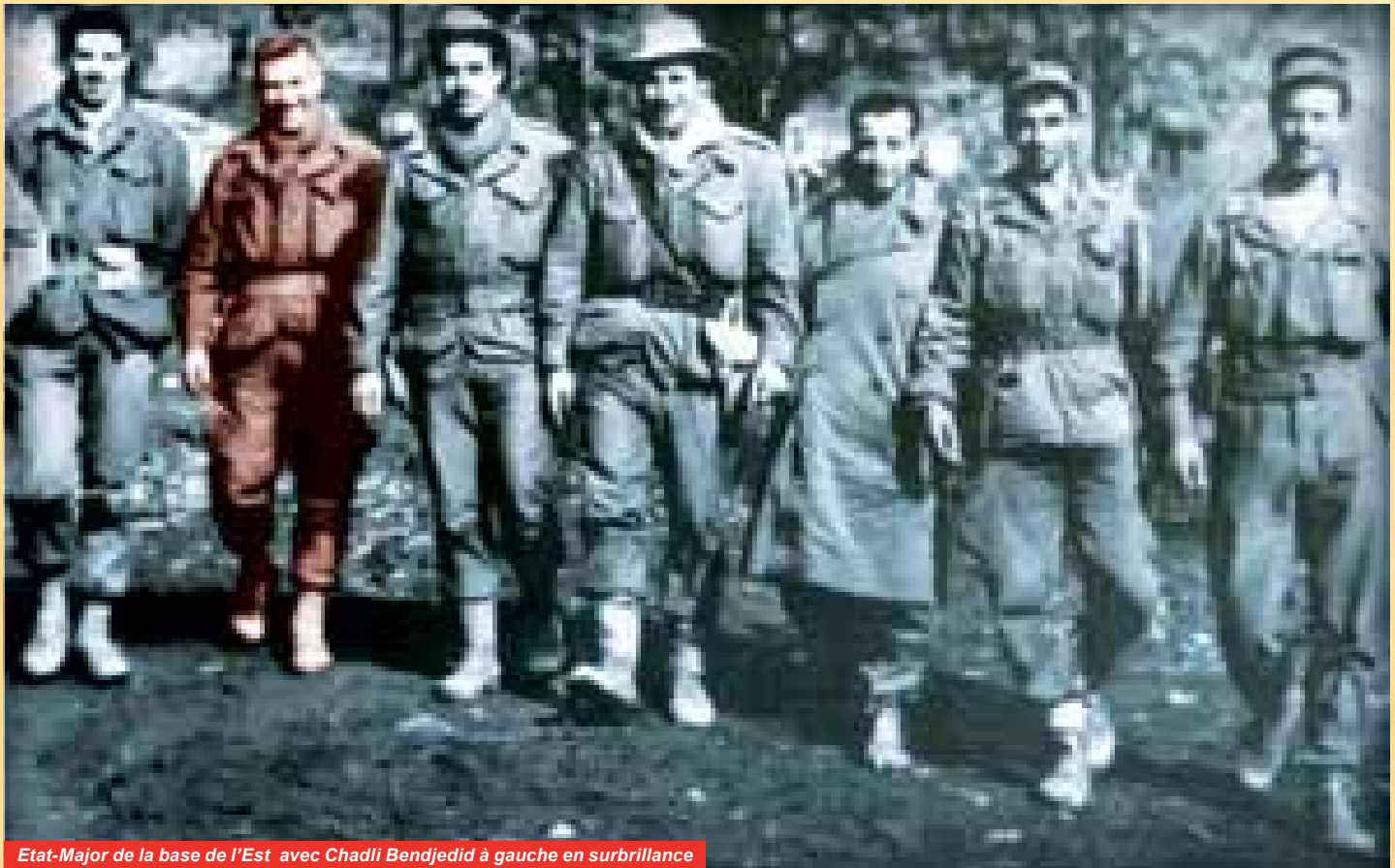
Etat-Major de la base de l'Est avec Chadli Bendjedid à gauche en surbrillance