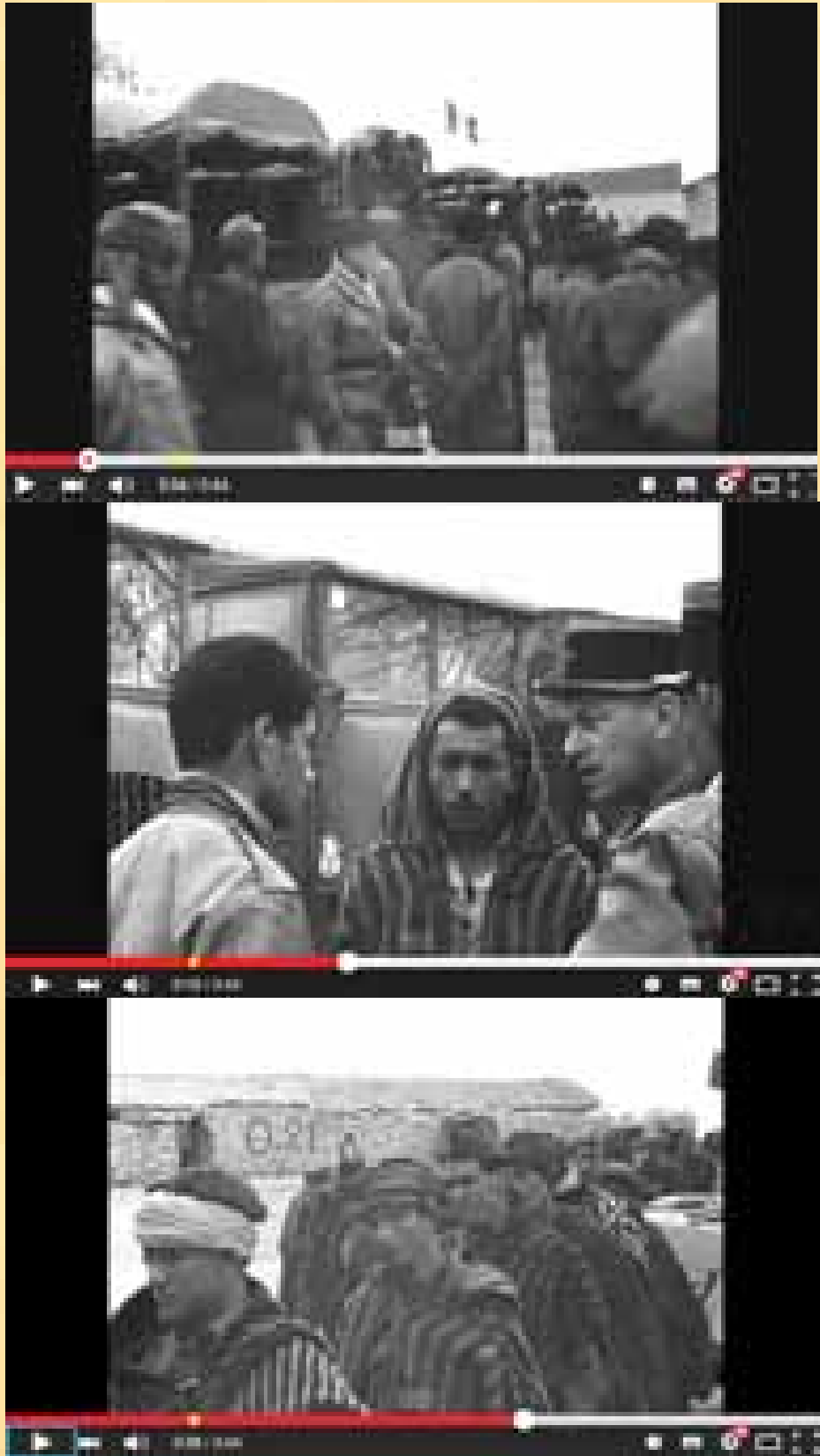
Extraits d'une vidéo sur le web qui montrent les hommes de Ali Hambli placés sous la protection de militaires français, et transportés à bord de camions militaires. Aïn Beida, le 22 mars 1959.