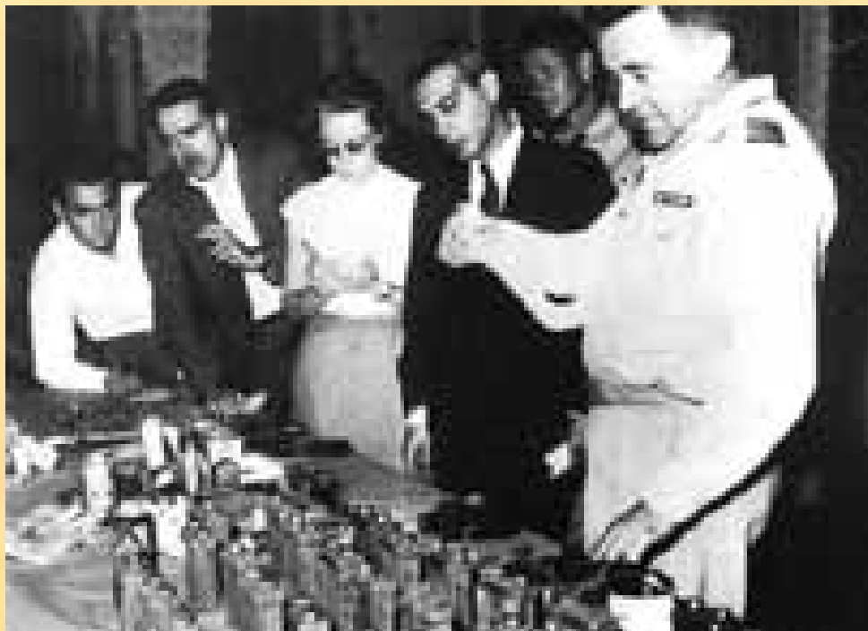
Démantèlement du réseau bombes de Yacef Saâdi, le colonel Godard présente à la presse 33 bombes récupérées lors d'une fouille à la Casbah d'Alger

L'Armée de libération nationale, en affrontant désarmé les balles assassines. La révolution vient de signer sa victoire, plus rien ne pouvait l'arrêter. L'historien allemand, le Pr Hartmut Elsenhans, parle de « Diên Biên Phu politique de la guerre d'Algérie ». C'était le cas, l'objectif du 1er novembre s'est accompli, la population a pris le flambeau pour l'exhiber aux yeux du monde entier et à ceux de l'occupant. Ce sera le début de la reconnaissance de la nation algérienne et le catalyseur de tous les événements qui vont amener l'Etat français à Evian, et à reconnaître, enfin, l'indépendance de l'Algérie.