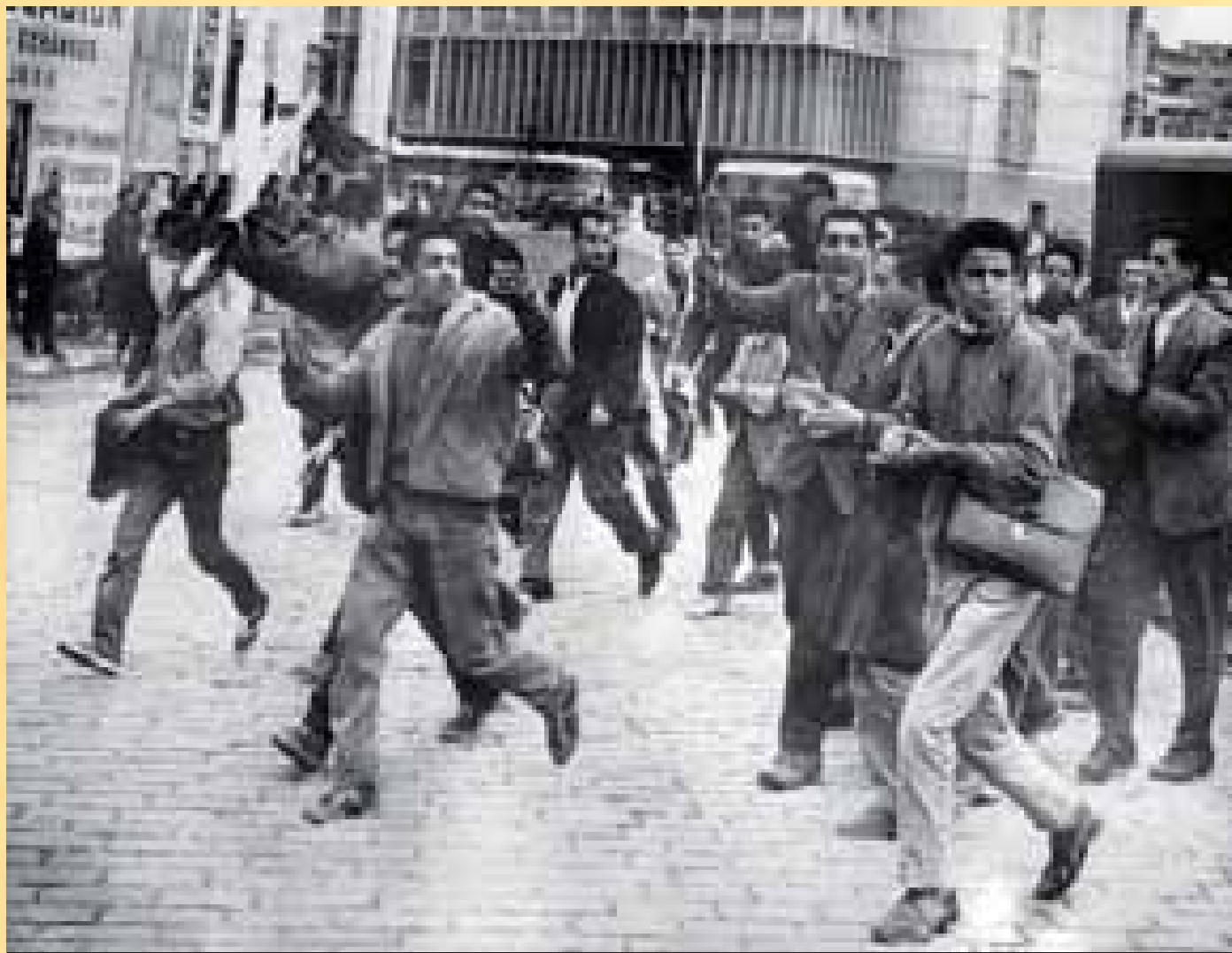
Manifestations de décembre 1960