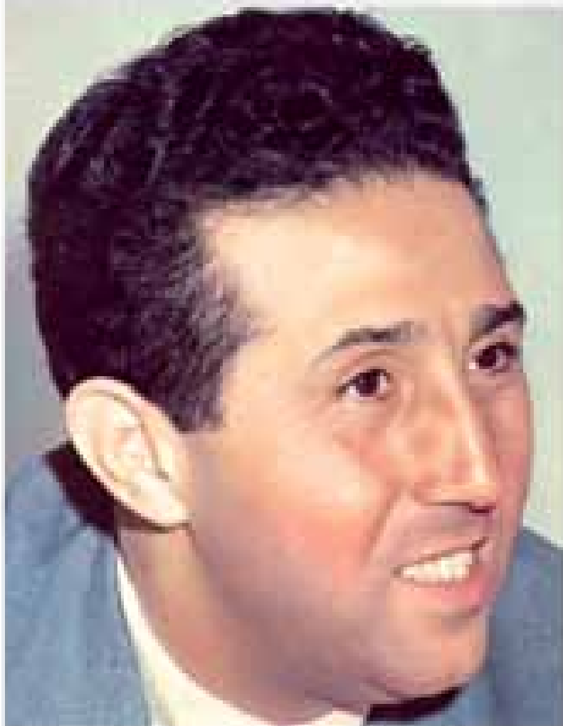
Ahmed BEN BELLA