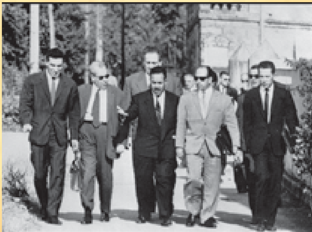
La délégation du gouvernement provisoire de la République algérienne (GPRA) à Lugrin, en Haute-Savoie, le 20 juillet 1961

des calculs les plus pessimistes. Le peuple rejoignait, au grand jour,