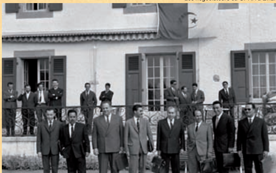
Les négociateurs du GPRA à Evian

Dans la plus grande discrétion, deux hélicoptères transportèrent les trois émissaires des djounoud