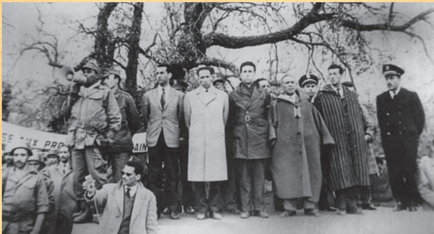
Hocine Aït Ahmed, Ahmed Ben Bella, Rabah Bitat, Mohamed Boudiaf et Mohamed Khider au Maroc

naissent une fois pour toutes aux peuples qu'elles subjuguent le droit de disposer d'eux-mêmes. » Dans son discours du 16 septembre 1959, le général de Gaulle reconnaissait le droit du peuple algérien à l'autodétermination. Le GPRA répondit aussitôt en déclarant que « la paix