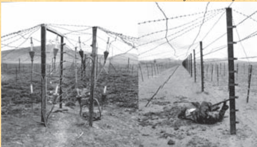
Les barrages électrifiés de la ligne Challe