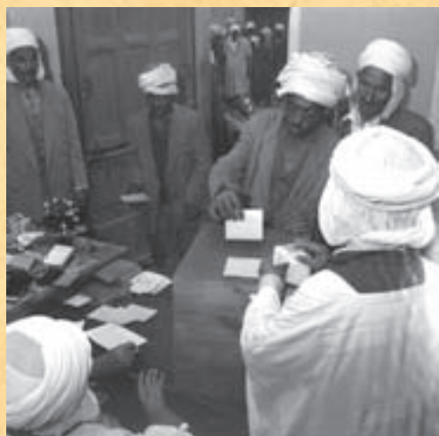
Le référendum sur l'autodétermination