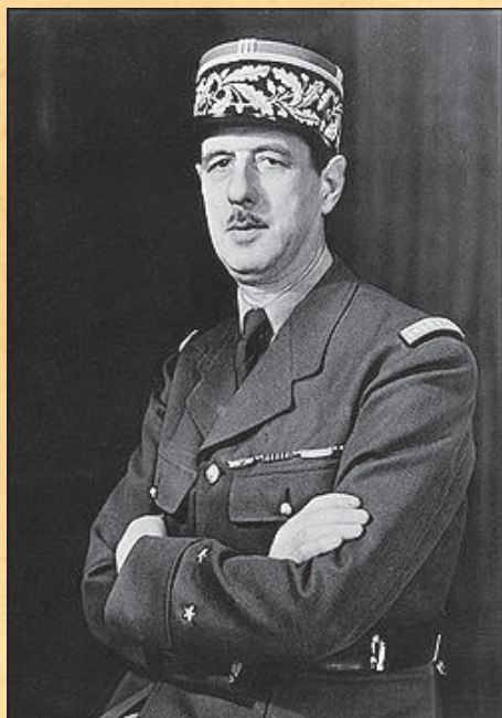
Général de Gaulle