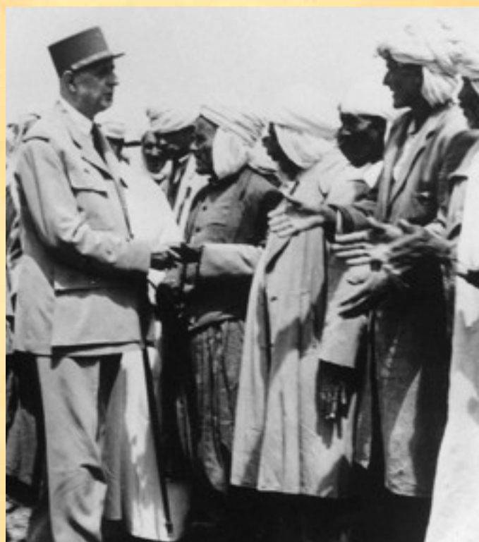
De Gaulle sauvant des harkis