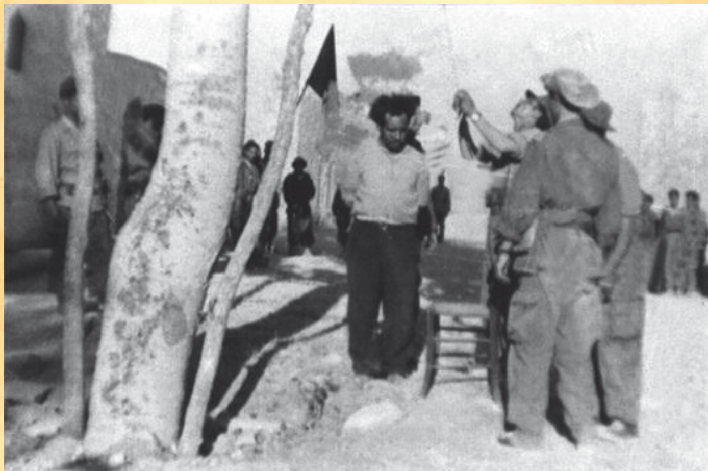
L'exécution d'un chahid par les troupes de Bellounis

Ces deux versions sont démontées par des témoignages concordants qui affirment que le milicien Bellounis a été éliminé, par des harkis certes, mais suite à la traque