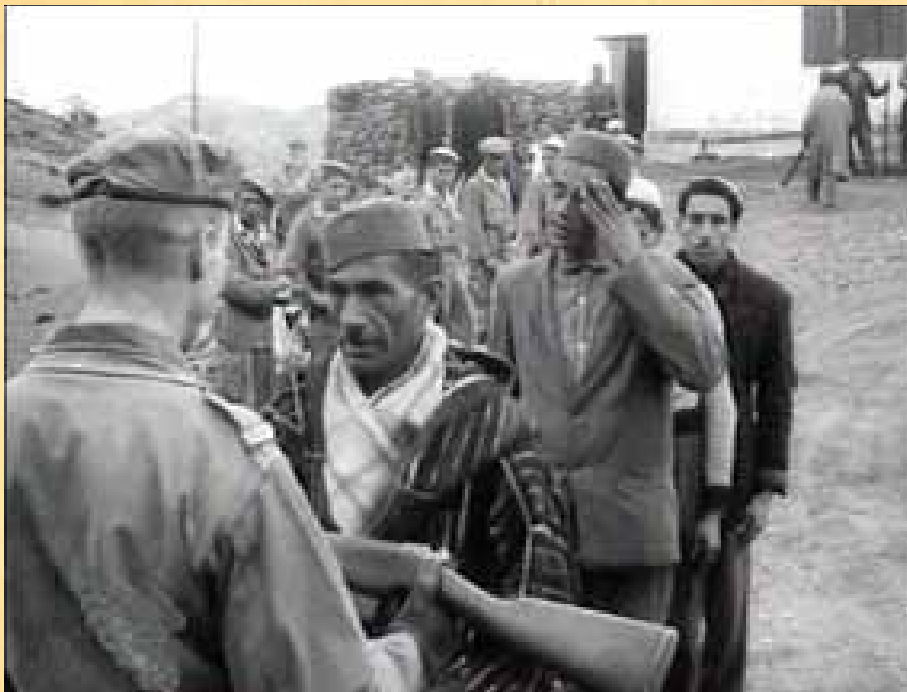
Remise des armes aux harkis

Selon des témoignages écrits, les premiers accrochages avec les troupes de Kobus, qui eurent lieu en 1957, éveilleront de nombreux éléments manipulés sur la vérité de leur chef, lesquels décidèrent