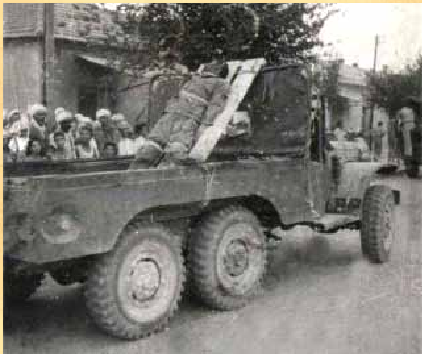
Le corps de Bellounis sur un camion militaire de l'armée française