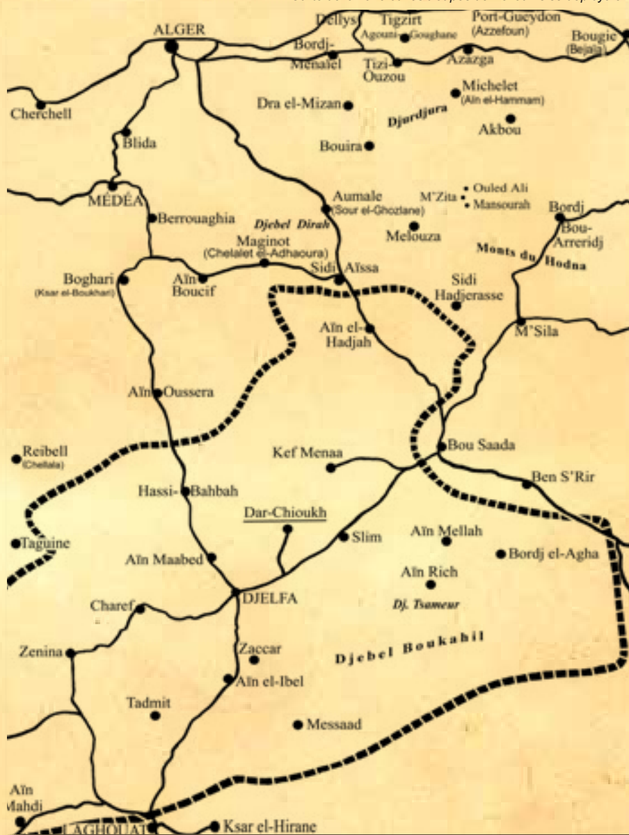
Carte de la zone où les troupes de Bellounis se déployaient

Bellounis avait adhéré, dès le début des années 1940, au seul parti indépendantiste de l'époque, le PPA, et a participé aux manifestations du 8 mai 1945 à Sétif. Recherché par la police coloniale, il a été arrêté à plusieurs reprises et emprisonné. A sa sortie de prison, il reprend ses activités militantes au sein du MTLD, vitrine officielle du PPA, et devient responsable du parti pour tout l'arrondissement de Bordj Bou Arreridj. Quand la grave scission au sein du parti, entre son leader historique Messali El-Hadj et les