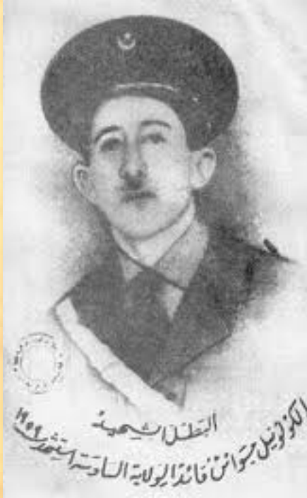
Colonel Si El-Haoues