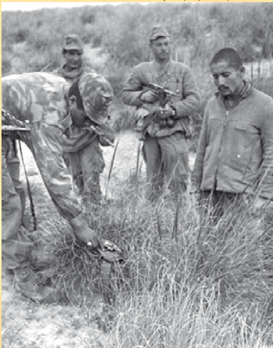
Un moudjahid capturé par les troupes de Bellounis

de se retourner, laissant se dévoiler une mitraillette sous la kachabia. Alors, le gommier lui tira dessus, le prenant pour un des moudjahidine de l'ALN dissimulé. C'est seulement après que le harki en question et les parachutistes français se seraient rendu compte qu'il s'agissait du «général» Bellounis. Son corps sera ensuite exposé dans tous les villages de la région, pour montrer que ce sont les soldats de l'armée française qui l'ont tué, alors qu'ils l'ont eu par pure hasard. Et ce