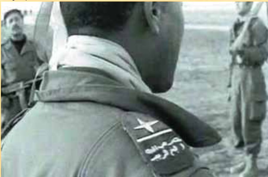
Slogans portés sur les tenues des soldats de Bellounis

C'est ainsi qu'en 1955, il réussit à créer son propre maquis dans la région de Bordj Bou Arreridj, et une milice armée forte de 500 combattants. Son champ d'action s'étendra jusqu'en Kabylie, à l'ouest, et à Djelfa vers le Sud. Acculé par les troupes des moudjahidines de l'ALN qui le chassaient de ses principaux fiefs, notamment suite aux événements de Mellouza et de Béni Ilmane en 1958, le poussèrent à s'allier avec l'armée française. Une aubaine pour l'ennemi qui contracta aussitôt une alliance avec lui et décida de le nommer « général ». La seule condition de Bellounis est que le gouvernement français ne reconnaisse plus le FLN, comme représentant de la lutte du peuple algérien. Ce soutien lui permit de renforcer sa milice baptisée ANPA (Armée nationale du peuple algérien), qui comptera désormais quelques 3000 hommes armés, et d'établir un quartier général, à Diar Chioukh dans son vaste fief entre Aumale et Aflou dans le