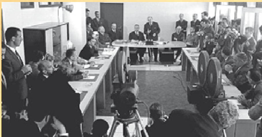
Abderrahmane Fares, président de l'exécutif provisoire, à Rocher Noir à Boumerdès, le 7 avril