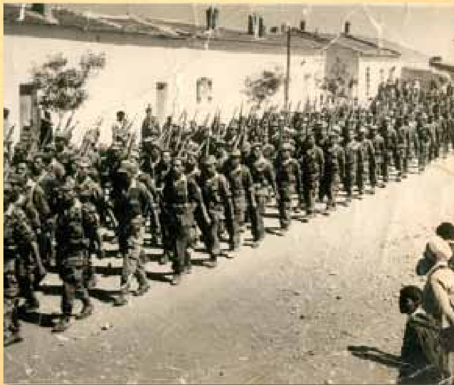
Les troupes de Bellounis