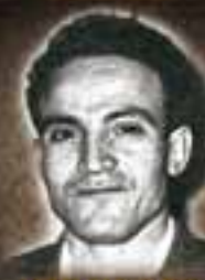
LARBI BEN M'HIDI