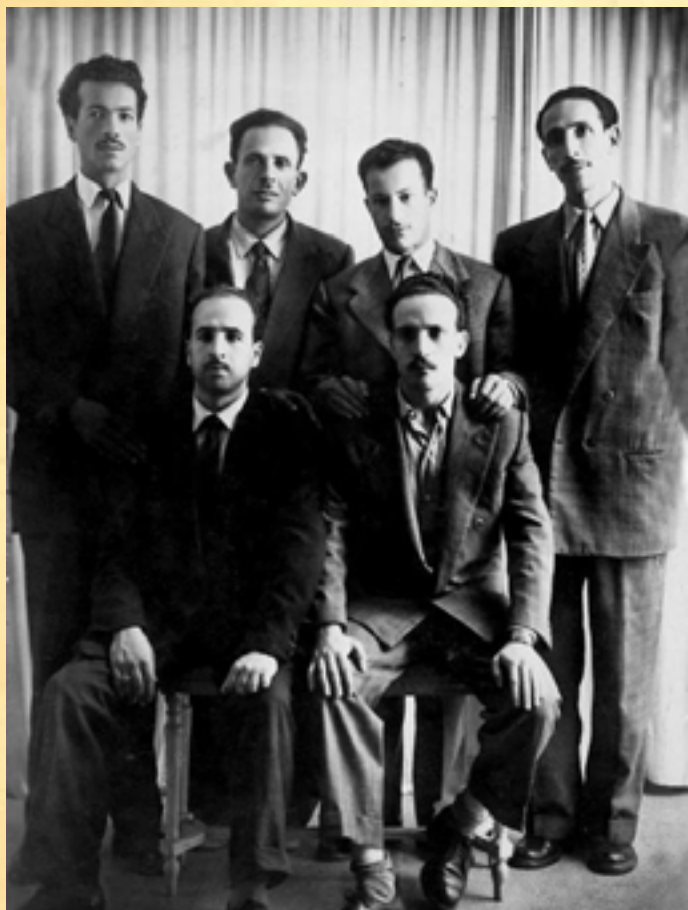
Les six historiques