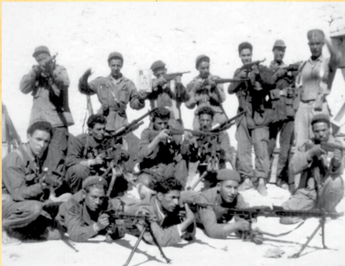
Combattants de la Wilaya IV