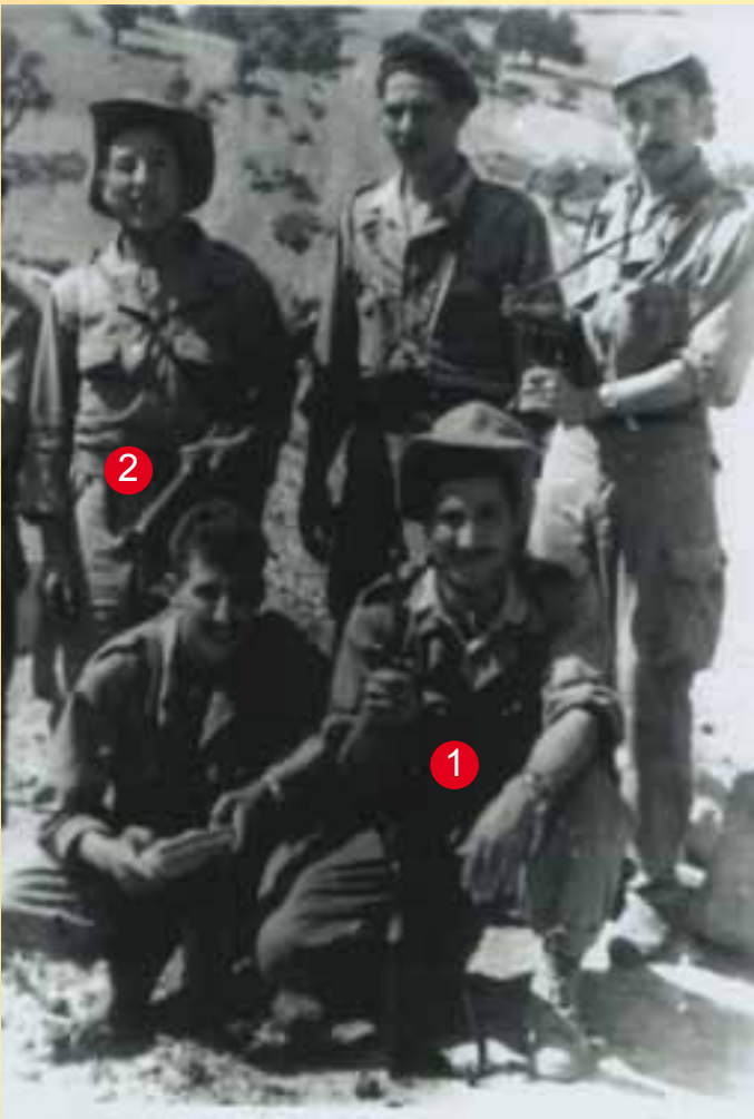
1 - M'hamed Bouguerra. 2- Commandant Si Lakhdar.

Le colonel Si M'hamed a maintenu une pression continue sur l'armée coloniale, en imposant de véritables zones libérées dans l'Ouarsenis, le Zaccar, l'Atlas blidéen et les monts de Médéa, tout comme il a dirigé de grandes batailles à Amrouna, Theniet El-Had, dans l'Ouarsenis, à Bouzegza, dans le Zaccar et aussi à Oued El-Maleh, Oued Fodda.